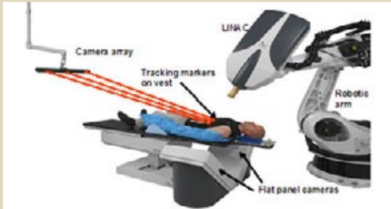
ويئەى 2 چەقوى سايبەر و ميژى نەخوش و كۆلیمەيتەرى تاودەر بە قۆلى رۆبوتو ريزەكاميرا.

ميژوويى ئەم تەكنيكە بۇ سالانى 1950 دەگریتەو كە نەشتەرگەريكى