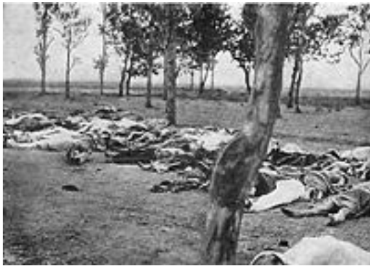
دیمہ نیک له کۆکۆژی ئەرمنه کان

سولتان عەبدولحەمید، ھەنوگە بوو تە بابەتییکی سەرھەکی و گەرمی میدیاکان، بەتایبەتی لە میدیاکانی پۆژئاوا، بوو تە مەسەلە یەک کە دەولەتی تورکیای تارادەییەکی زۆر ئیحراج کردوو، تەنانەت کار گەشتوو تە ئێوەی دەولەتی تورکیا ھەپەشە ئێوە دەکات، ئێگەر ئێم مەسەلە یە رانەو سەتین و سنوریکی بۆ دانەنن، ئێوا نزیکە سەد ھەزار ئەرمنی کە لە ولاتە کەیدا دەژین، دەر دەکات. جگە لەوە لە لایەن چەند ولاتیکی ئێورۆپییە و ھەولییکی زۆر خراوە تە گەر بۆ ئێوەی مەسەلە ی کوشتبوری ئەرمنیەکان بە جینۆساید بناسریت و ئێم ھەولەش تورکیای زۆر نیگەرەن کردوو. لێرە وە بایەخی ئێم کتیبە زیاتر دەر دەکەوێت.